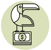
Tráfico de Fauna

El que trafique, adquiera, exporte o comercialice sin permiso de la autoridad competente o con incumplimiento de la normatividad existente los especímenes, productos o partes de la fauna acuática, silvestre o especies silvestres exóticas, incurrirá en prisión de sesenta (60) a ciento treinta y cinco (135) meses y multa de trescientos (300) hasta cuarenta mil (40.000) salarios mínimos legales mensuales vigentes.